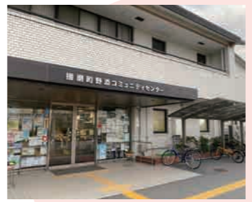
コミセン正面入口の写真 (3年前に外壁を改修)。