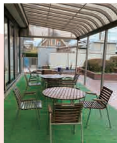
コミセンのテラスでは木のテーブルとイスでくつろげます。